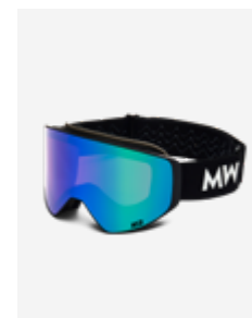
Black Green Mirrored SKU: CLBLGR