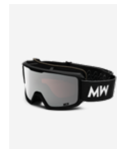
Black Silver Mirrored SKU: FEBISI