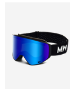
Black Blue Xep SKU: CLBIXe