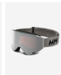
Light Grey Silver Mirrored SKU: CLLiSi