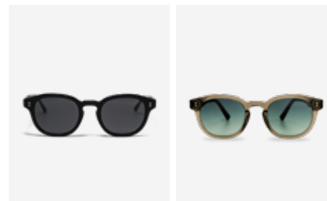
Black SKU: BIBKBK24