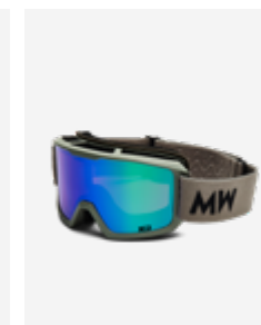
Light Grey Green Mirrored SKU: FELIGR