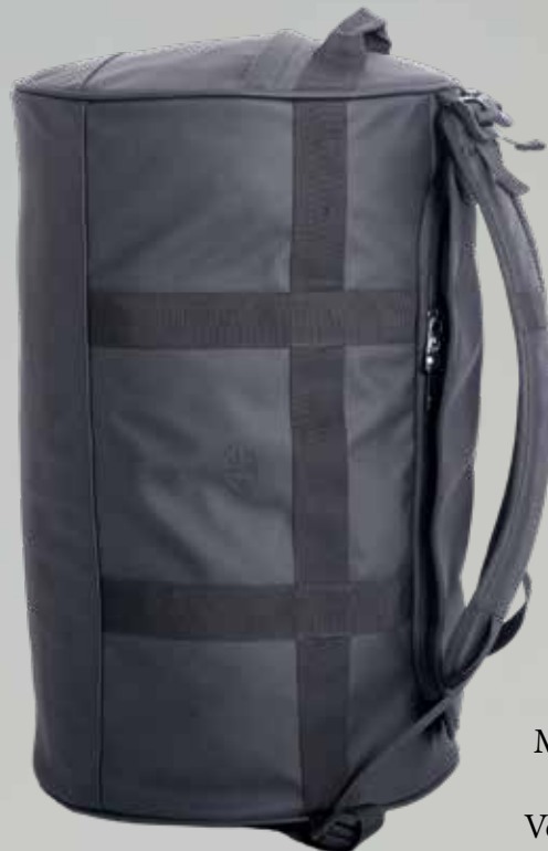
2680 Mål: 52 x 32 x 32cm. Farver: 29 sort Vejledende: kr. 799,95