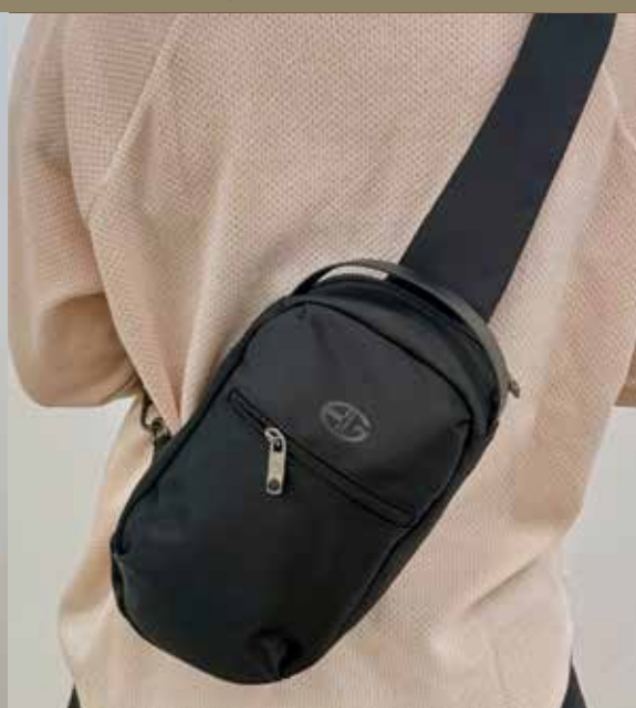
2682 Mål: 32 x 18 x 7cm. Farver: 29 sort Vejledende: kr. 399,95