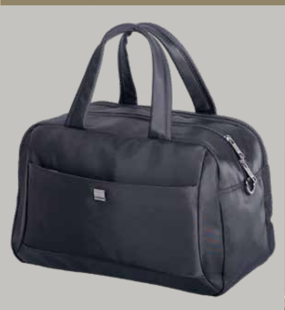
2674 Mål: 40 x 25 x 20cm. Farver: 29 sort Vejledende: kr. 599,95