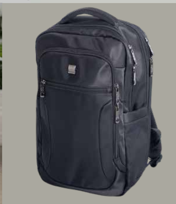
2690 Mål: 40 x 25 x 15/20cm. Farver: 29 sort Vejledende: kr. 699,95