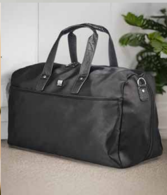
2673 Mål: 52 x 32 x 20cm. Farver: 29 sort Vejledende: kr. 999,95