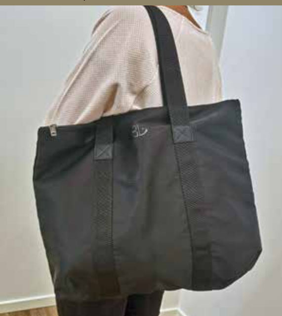
2683 Mål: 41 x 40 x 16cm. Farver: 29 sort Vejledende: kr. 399,95