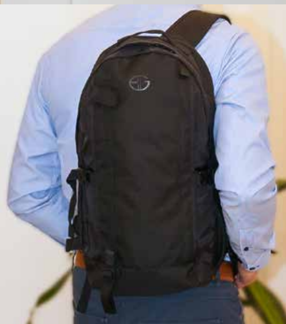
2664 Mål: 44 x 29 x 14cm. Farver: 09 sort Vejledende: kr. 499,95