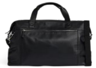
JULIAN WEEKEND BAG ANB. B2B PRIS DKK EX. MOMS 560,-