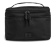
TREASURE TOILETRY BAG ANB. B2B PRIS DKK EX. MOMS 300,-