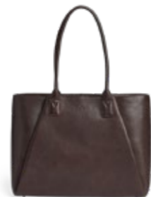
SAYA WORK BAG ANB. B2B PRIS DKK EX. MOMS 560,-