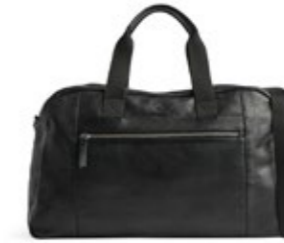
WESLEY WEEKEND BAG ANB. B2B PRIS DKK EX. MOMS 640,-