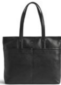
MOLINA SHOPPER ANB. B2B PRIS DKK EX. MOMS 400,-