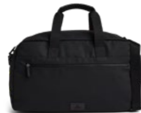
ATLAS WEEKEND BAG ANB. B2B PRIS DKK EX. MOMS 400,-