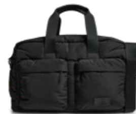
MORE WEEKEND BAG ANB. B2B PRIS DKK EX. MOMS 400,-