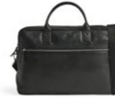
VINCENT 14" LAPTOP BAG ANB. B2B PRIS DKK EX. MOMS 560,-