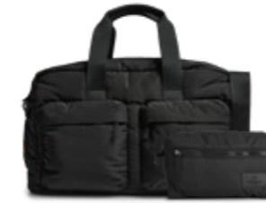
MORE WEEKEND BAG + JOSEPHINE TOILETRY BAG ANB. B2B PRIS DKK EX. MOMS 560,-