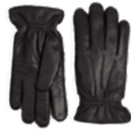
TRISTAN GLOVE ANB. B2B PRIS DKK EX. MOMS 250,-