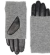
HELLY GLOVE ANB. B2B PRIS DKK EX. MOMS 300,-