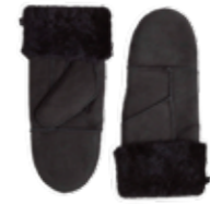
BELLA MITTEN ANB. B2B PRIS DKK EX. MOMS 250,-