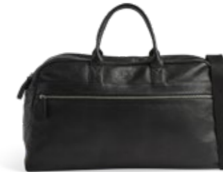
THEODORE WEEKEND BAG ANB. B2B PRIS DKK EX. MOMS 800,-