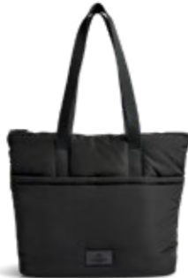
PERRY SHOPPER ANB. B2B PRIS DKK EX. MOMS 300,-