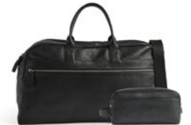
THEODORE WEEKEND BAG + DOMINIC TOILETRY BAG ANB. B2B PRIS DKK EX. MOMS 960,-