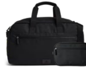
ATLAS WEEKEND BAG + SIMON TOILETRY BAG ANB. B2B PRIS DKK EX. MOMS 560,-