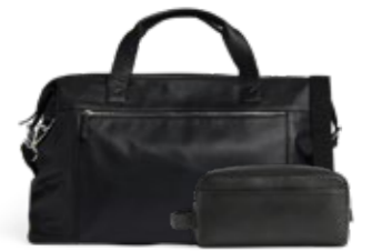
JULIAN WEEKEND BAG + DOMINIC TOILETRY BAG ANB. B2B PRIS DKK EX. MOMS 720,-